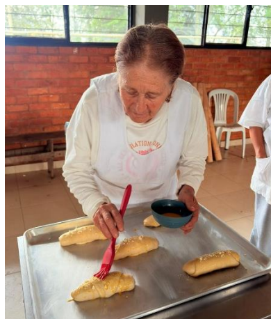
Foto 2. Elaboración de pan.