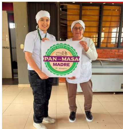
Foto 3. Foto final con el sello.